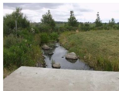
2019 FAA unterhalb Wehr Löcknitz (nachher)