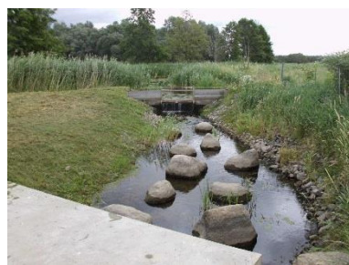
2019 FAA oberhalb Wehr Löcknitz (nachher)